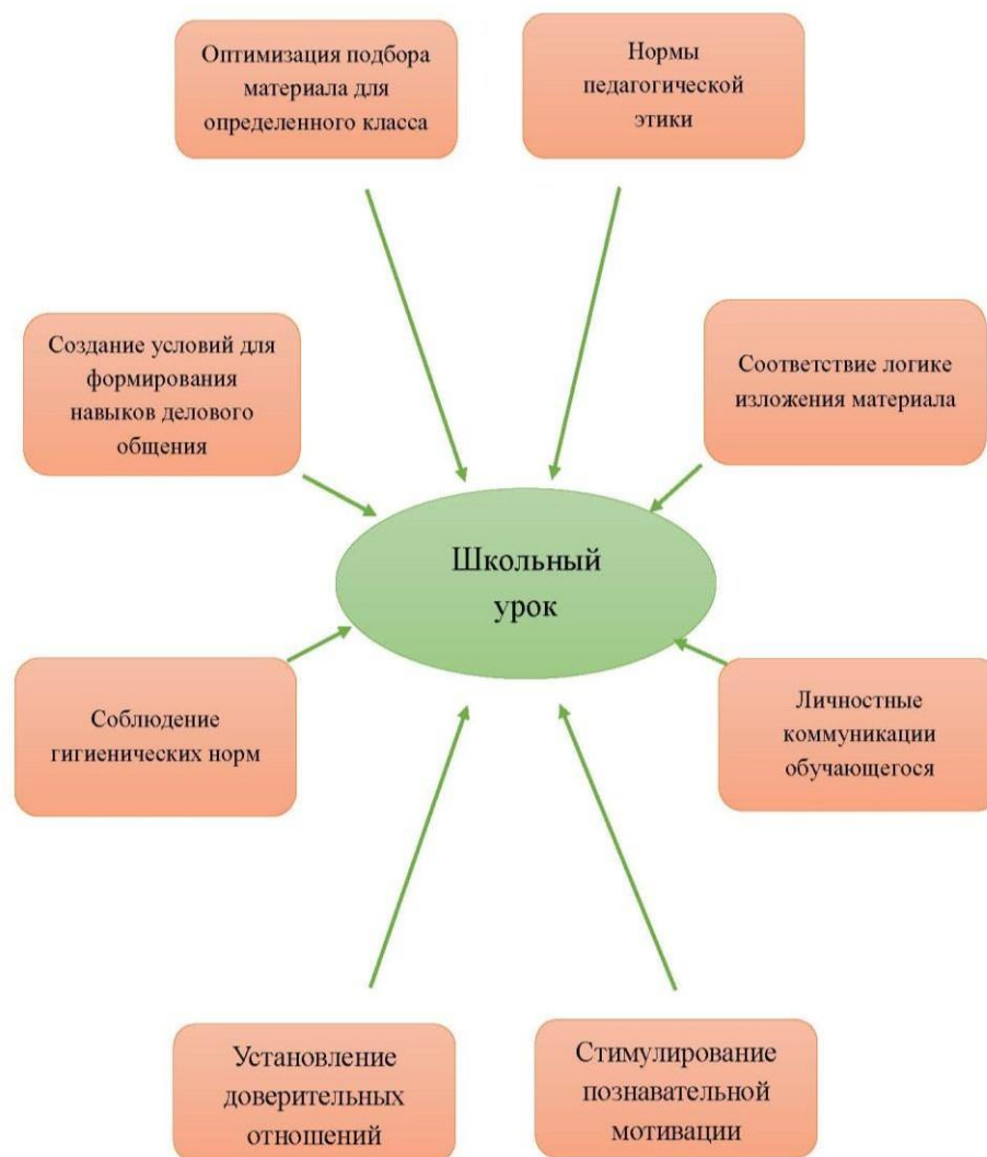
Схема 2 Модель «Школьный урок»